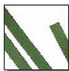
Coupe fibres 4 mm Niveau de sécurité DIN 2 Documents internes.