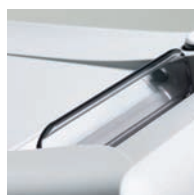
Volet de sécurité électronique