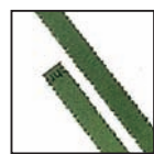
Coupe fibres 4 mm Niveau de sécurité DIN 2 Documents internes.