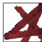
Coupe croisée 4 x 40 mm Niveau de sécurité DIN 3 Documents confidentiels.