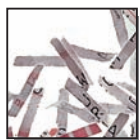
Coupe croisée 2 x 15 mm Niveau de sécurité DIN 4 Documents confidentiels ou secrets.